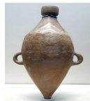
③山西丁村出土的小口尖底瓶彩陶